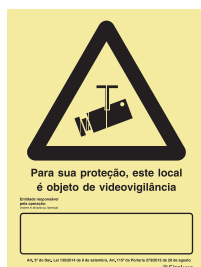
P 35 73

De acordo com do DL 135/2014, de 8 de setembro.