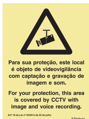
P 35 76

De acordo com a Lei n.º 52/2013 de 25 de Julho.