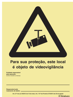
P 35 75

De acordo com a Lei nº 34/2013, de 16 de maio e Portaria 273/2013, de 20 de agosto.